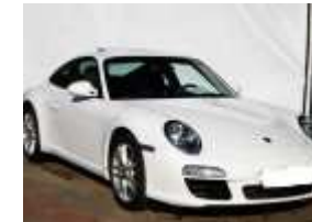
Luksusowe Porsche 911 Golf - najlepsze oferty Najlepsza dziesiątka