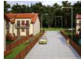
Sopot, NOWA INWESTYCJA Mieszkania na sprzedaż Mieszkania do wynajęcia

- Dużym zaskoczeniem było to, że Kraków przypomina miasta Europy Zachodniej znacznie